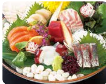
刺身5種盛 ..... 1,749円(税込)