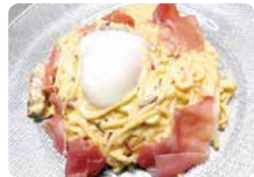
たっぷりチーズとパンチェッタの 究極の冷製カルボナーラ ..... 1,758円(税込)