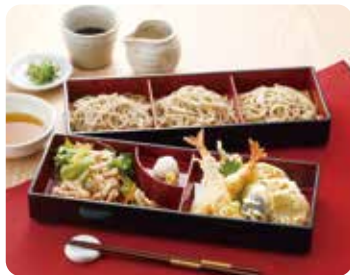
大名天ざる ..... 1,480円(税込)