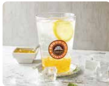
柚子レモンソーダ ..... 590円(税込)