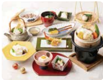
めでたいランチ ..... 3,800円(税込)