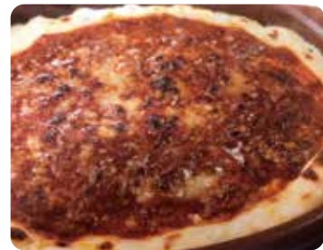
ミラノ風ドリア ..... 300円(税込)