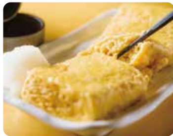
自家製!出し巻き玉子 ..... 480円(税込)