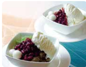
かき氷 宇治金時・ミルク金時 ..... 各850円(税込)